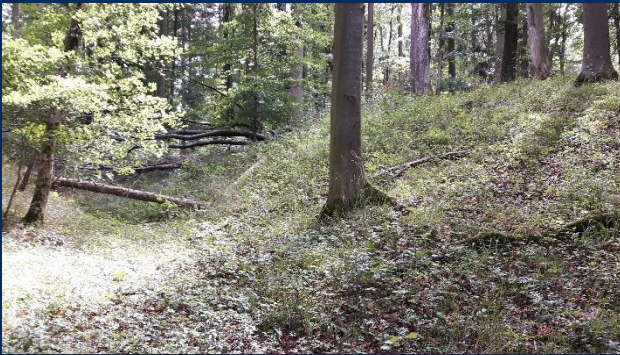
Wallanlage bei Beimbach

Begeben Sie sich auf eine regional kulturelle Zeitreise – 2500 Jahre in die Vergangenheit.